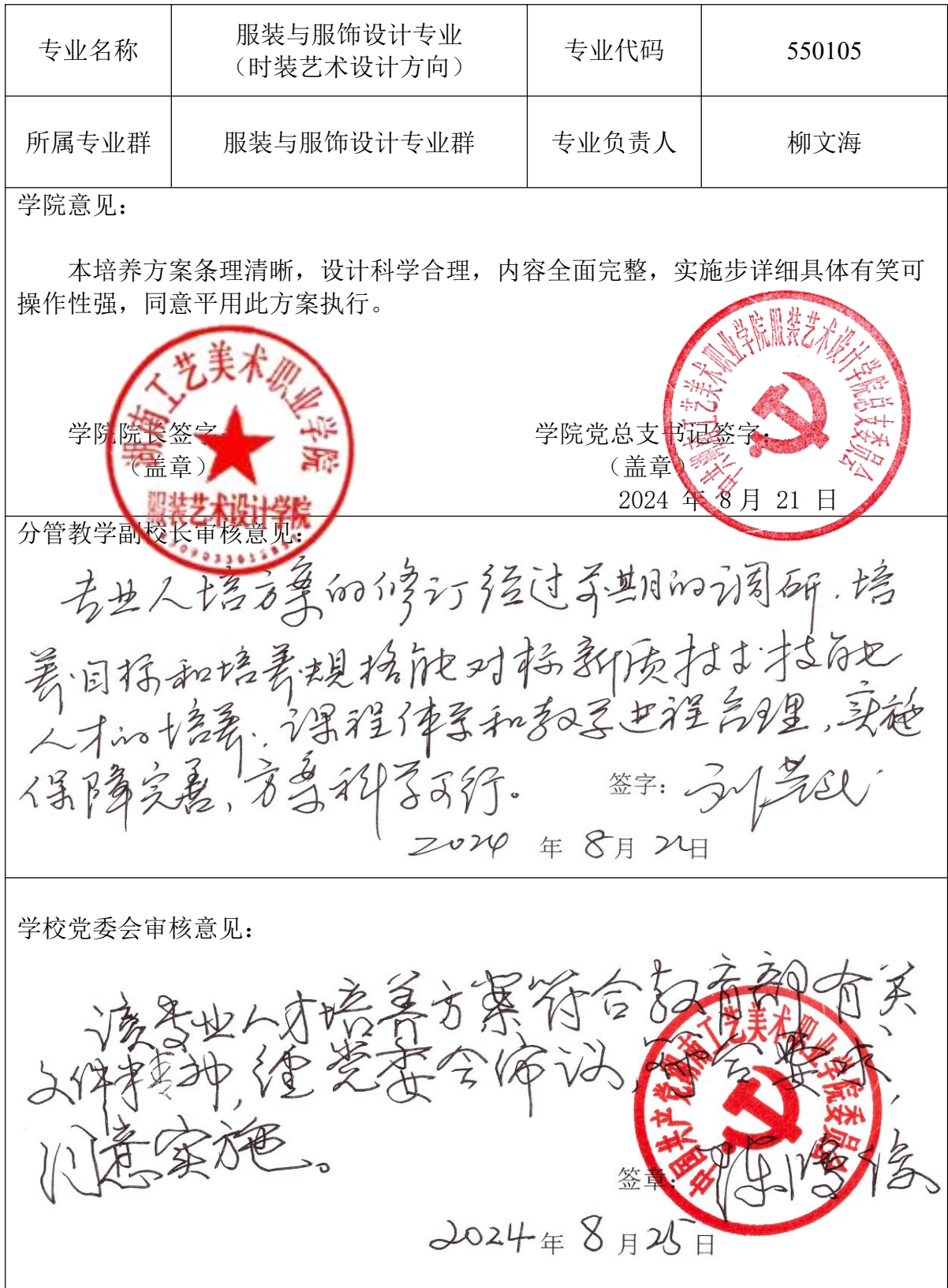
人才培养方案审批表